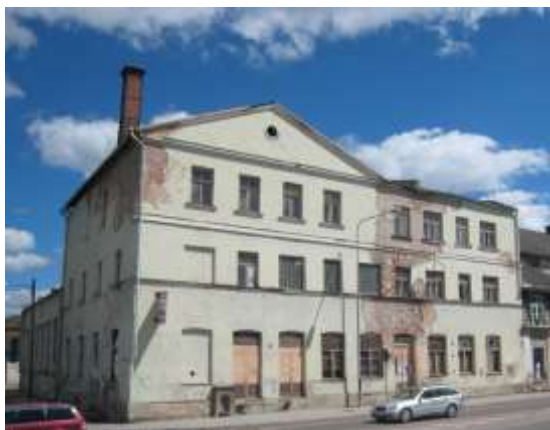
Foto 8. Säiliv endise pärmivabriku peahoone fassaad ja korsten

Pika tänava äärse hooneosa esimese korruse tasandile ja endisesse toorainemahutisse (vt joonis 4) tuleb projekteerida avalikkusele suunatud äripinnad. Planeeringuga on pakutud lahendus 1195 m 2 avalikkusele suunatud äripinna ja kuni 11550 m 2 elamispinna kavandamiseks. Pindade suhet on lubatud projektiga täpsustada tingimusel, et parkimise ja haljastuse nõuded on tagatud.