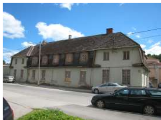
Foto 6. Endine pärmivabriku kontorihoone