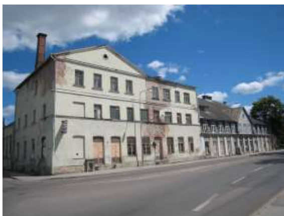
Foto 2. Vaade Pikalt tänavalt

Hoovis asub 1927. aastal ehitatud piiritusekelder-ladu (foto 3), mille ümar juurdeehitus pärineb 1935. aastast. Pärna tänava ääres asub kahekorruseline pärmivabriku kontorihoone (foto 6). Teised vabrikut teenindavad hooned on käesolevaks ajaks lammutatud. Planeeringuala kirdepoolsele piirile on hilisemalt ehitatud ühekorruseline garaaž ja sõidukite teenindushoone (foto 4). Krundi sügavuses asub ühekorruseline kasutuseeta töökoja hoone.