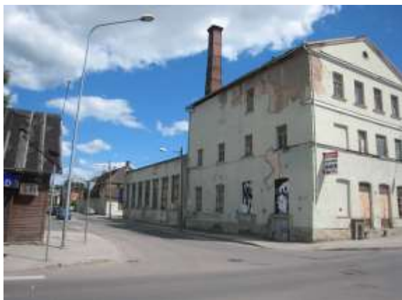
Foto 1. Pärnivabriku endine peahoone

Pika ja Pärna tänavate ristmikul Pikk tn 58 // Pärna tn 1 krundil asub endise pärmivabriku 1883. aastal ehitatud 3-korruseline peahoone (foto 1), millele on hiljem Pärna tänava poolsele küljele rajatud 1-korruseline juurdeehitis.