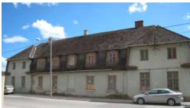
Foto 10. Säiliv Pärna tn äärne endine pärmivabriku kontorihoon